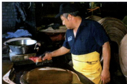
Beim ‚smearen‘ wird warmes natürliches Öl aufgetragen

Weil die kräftigen, großen Arbeitspferde mehr und mehr von Maschinen abgelöst wurden hat auch das Aufkommen großer Häute mit entsprechenden Shells, dem Fachbegriff der schildförmigen Lederstücke stark abgenommen. Die heute weit verbreiteten Pferderassen der Sportpferde sind selten zur Cordovan-Gewinnung geeignet.