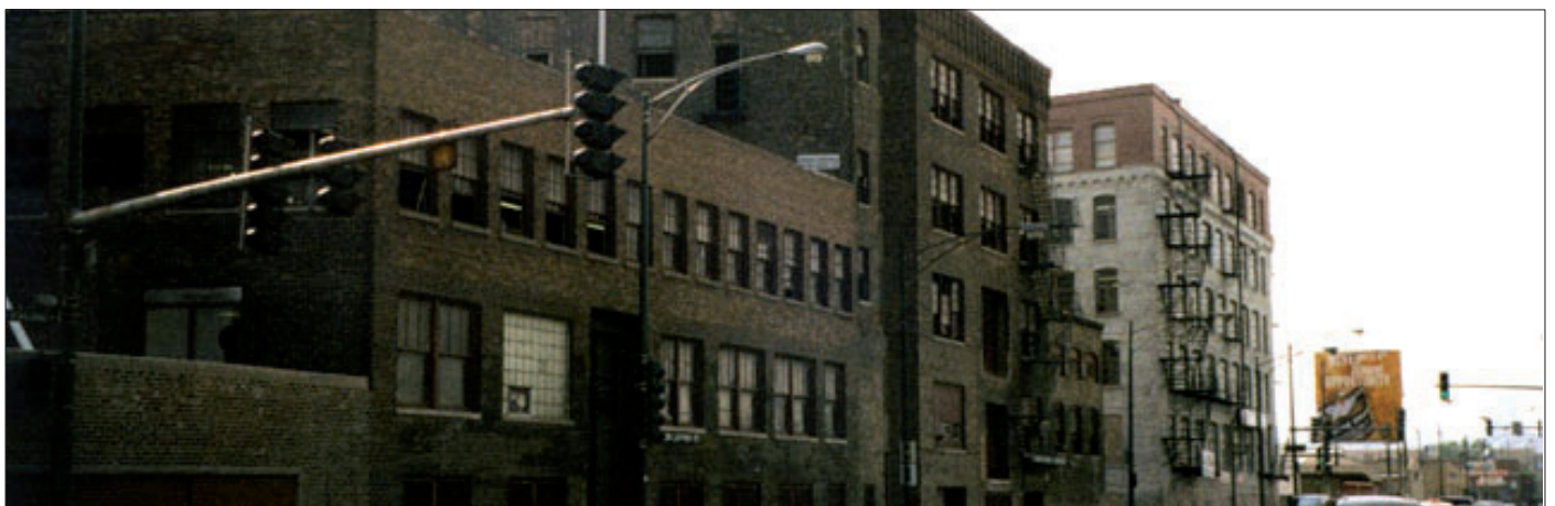
Firmengebäude der Horween Leather Company in Chicago/USA

Alle Herstellungsprozesse zusammen benötigen eine über 6-monatige Produktionszeit. Das Herausarbeiten des Shells aus der Pferdehaut erfolgt fachgerecht manuell und auf dafür eigens hierzu gefertigten Maschinen. Alle Arbeitsschritte benötigen durch die dichte Hautstruktur ihre Zeit, auch weil chemische Prozessbeschleuniger die bekannte Qualität ungünstig beeinflussen würden. Die vegetabile Gerbung mit natürlichen pflanzlichen Gerbstoffen erfolgt wie eh und je traditionell in der Grube. Ähnlich dem klassischen Gerbverfahren von hochwertigem Sohlenleder hat der sich aus Pflanzen langsam lösende Gerbstoff Zeit, das dichte Fasergeflecht