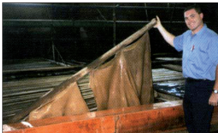
Die Gerbung erfolgt mit pflanzlichen Gerbstoffen in der Grube

Nur aus Teilen der Häute von Pferden und Mulas lässt sich dieses besondere Material herstellen. Im hinteren, breiteren Teil der Haut befindet sich bei diesen Tierrassen auf beiden Seiten der Schwanzwurzel ein besonders dicht strukturierter Teil. Die Größe dieser Stellen schwankt zwischen der Größe einer Hand und in heute seltenen Fällen bis zu 2 1/2 Quadratfuß.