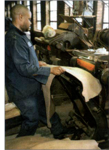
Auf der Blanchiermaschine wird das dicht strukturierte Cordovan Shell herausgearbeitet

Um den hochwertigen Teil der Pferdehaut fachgerecht bearbeiten zu können wird das hintere Drittel der Rohhaut abgetrennt und in speziellen Arbeitsprozessen in der Gerberei separat behan-