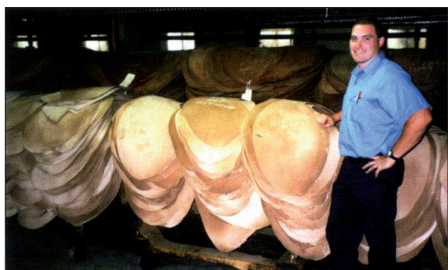
Gesmearte Cordovan lagern 90 Tage, bevor sie weiterverarbeitet werden

des Shells zu durchdringen. Die Bewegung der Häute beschränkt sich hier auf das Umhängen in die nächste Grube nach einem festen Rhythmus, damit weitere Gerbstoffmoleküle den Gerbprozess fortführen können. Die Häute werden hierbei praktisch nicht bewegt im Gegensatz zu modernen Verfahren. Das Ergebnis ist ein Stück Leder mit homogener, dichter und feinfasriger Struktur. Nach der Trocknung folgt für ein geschmeidiges Endprodukt das „smearen“. Hier wird nach alten Formulierungen gemischtes erwärmtes natürliches Öl einmassiert. Dies ist eines der Geheimnisse der außerordentlichen Zähigkeit von echtem Cordovan. Auf das smearen folgt eine mindest 90-tägige Lagerzeit, während der das Öl langsam in das Cordovan eindringen kann. Nach dieser Lagerzeit wird sortiert und von Hand gefärbt. Die einmalige Ausstrahlung und den Glanz verleiht der abschließende Vorgang